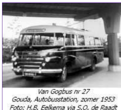
Van Gogbus nr 27 Gouda, Autobusstation, zomer 1953

In het huis-aan-huisblad Het Kanaal leverden de rubrieken Toen & Nu en Nieuwerkerkers van Toen weer volop lokale historalia.